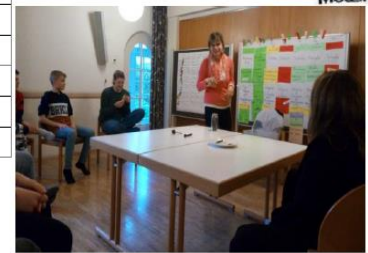
Nachmittag bei der Community WG 2.0